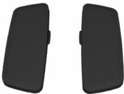
Sedus 3D Armauflagenpaar Softtouch für Bürostühle