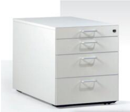
Rollcontainer Leuwico GARC1-1233 mit 3 Schüben und Materialschale