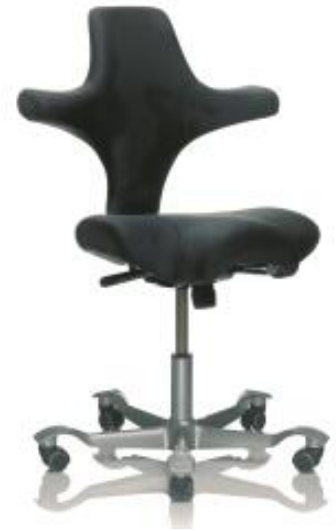
Bürostuhl HAG Capisco 8106

inkl. 19% MwSt., inkl. Versandkosten für Deutschland