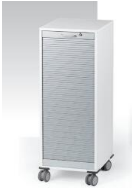
Caddy mit Vertikalrolläden Leuwico GACV2-04 mit Breitwandschub und 2 Einlegeböden

inkl. 19% MwSt., inkl. Versandkosten für Deutschland